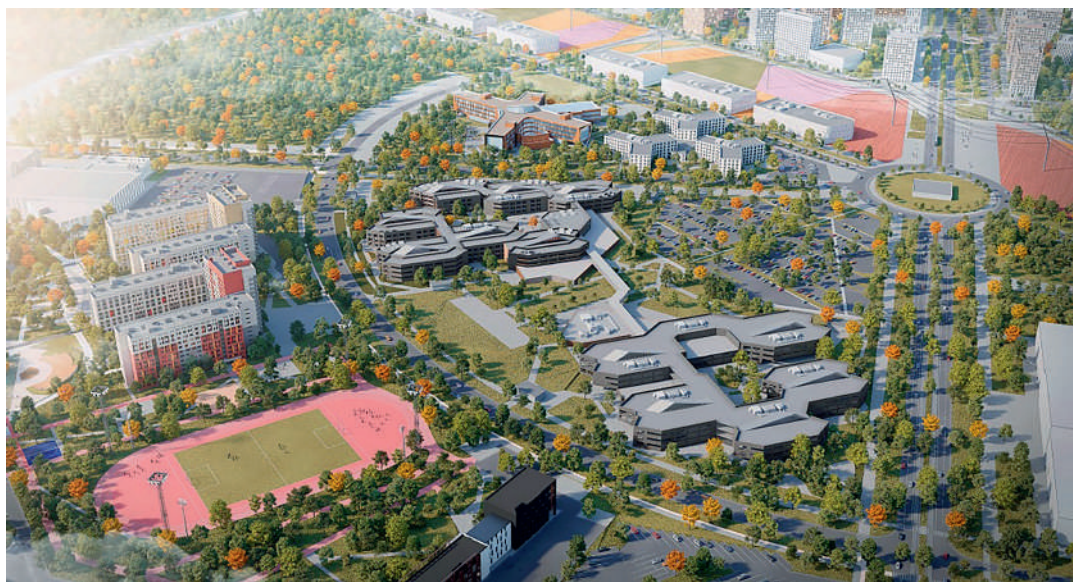
Кампус Уральского федерального университета — объект номер один

— Объект номер один — это кампус Уральского федерального университета, который строится в студенческом городке в Новокольцовском районе. На этой же площадке в прошлом году мы ввели в эксплуатацию крупнейший